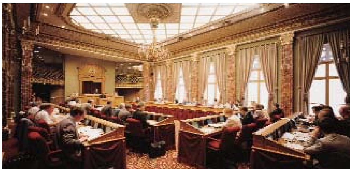
Парламент на пленарном заседании

Члены Прокуратуры подчиняются Государственному Прокурору, и отвечают за представление государства в судах и трибуналах. Прокуратура, в свою очередь отвечает перед Министром юстиции. Главной задачей членов Прокуратуры является расследование преступлений, нарушений и проступков, обеспечение соблюдения закона и выполнения судебных решений. Прокурорам Департамента Государственного Прокурора помогают в работе офицеры судебной полиции, которые регистрируют совершение уголовного нарушения, разыскивают виновных и собирают улики.